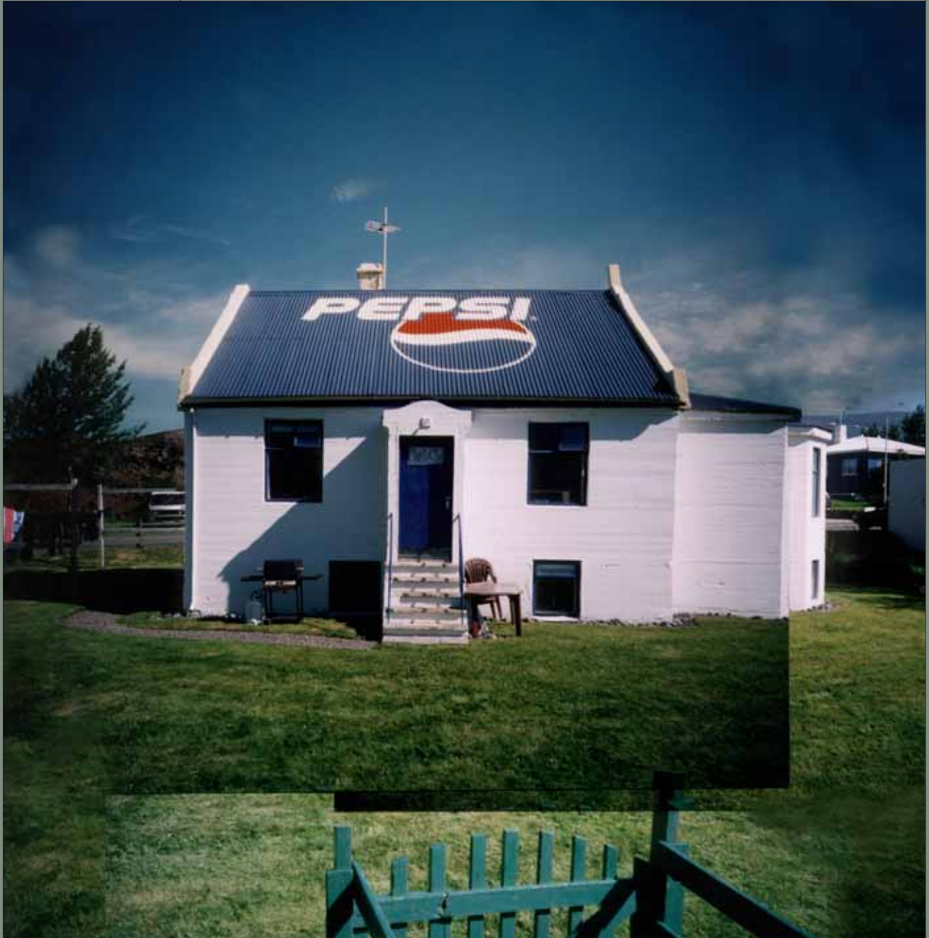
Pepsihúsið/The Pepsi House 2000 lomography 40 x 40cm