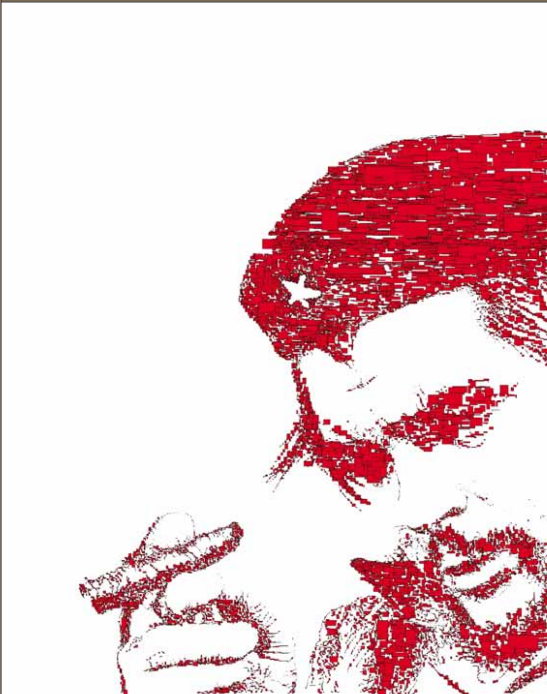
Divine Intervention 2003

magnussigurðarson@yahoo.com http://this.is/fyll/artists/maggi