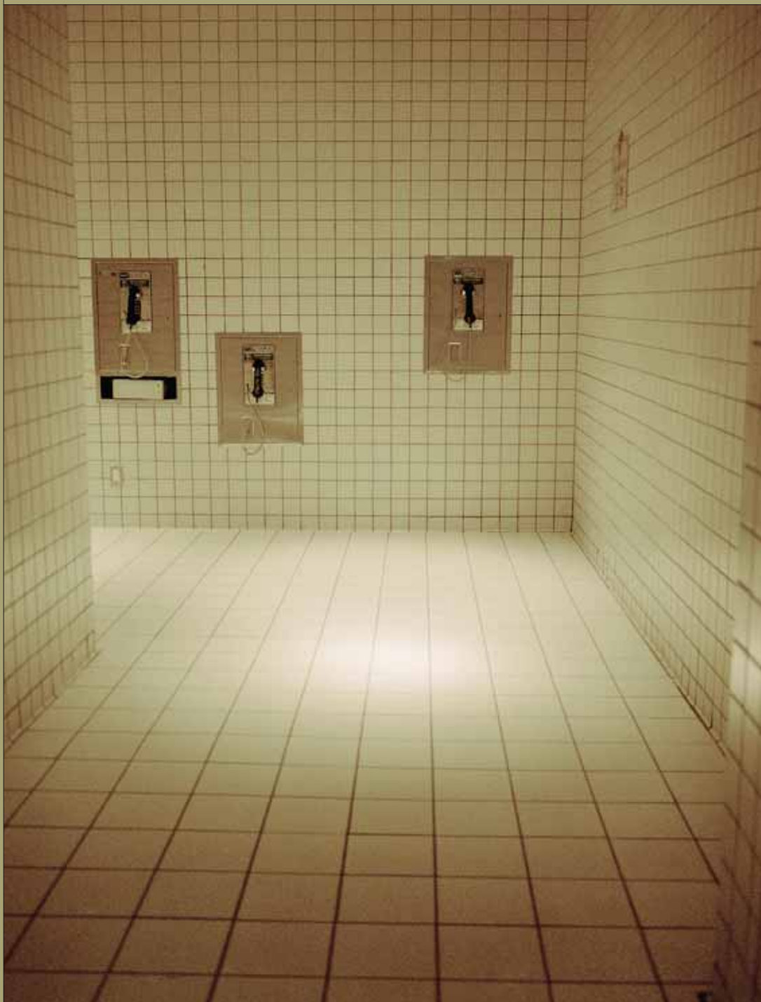
Shopping Mall 2004 ljósmynd/photograph 120 x 100 cm