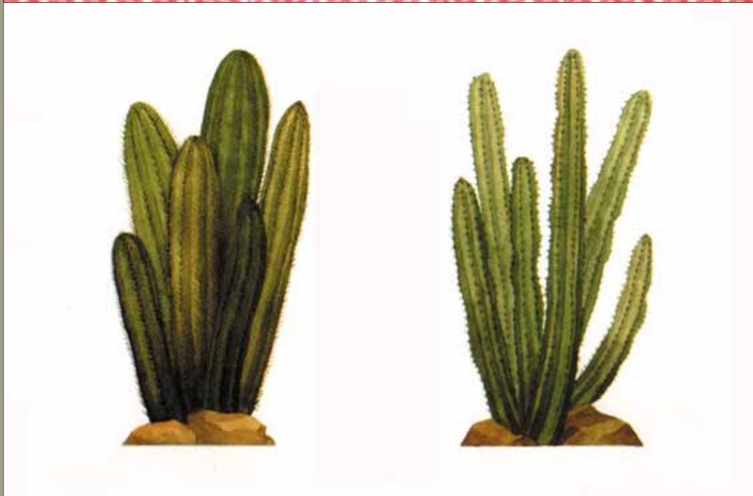
Determinism #2 2004 Stafræn ljósmynd / Digital photograph 70 x 60 cm.