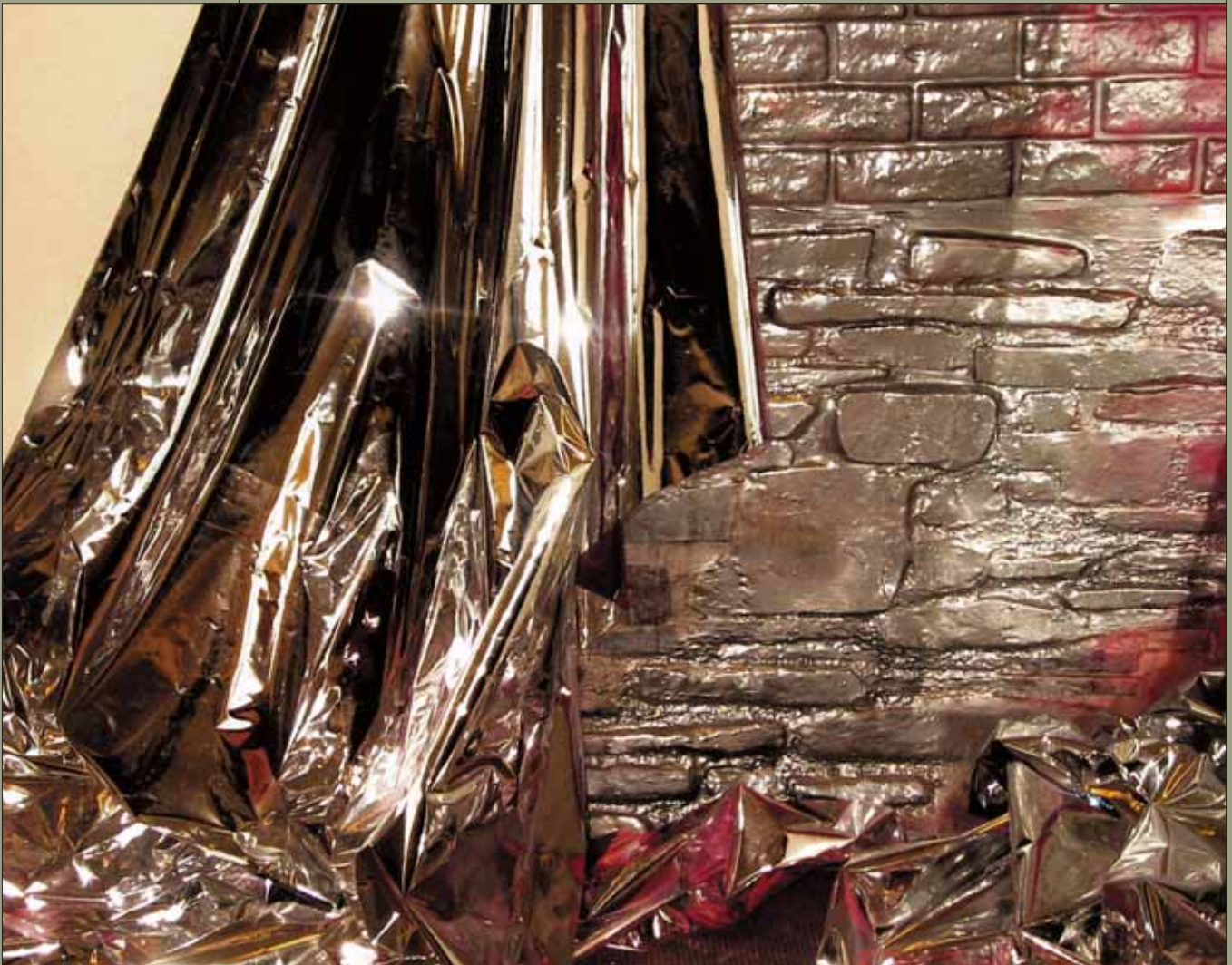
Cats 2004 ljósmynd/photograph